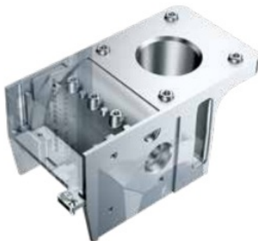
korpus aluminiowy, odlew ciśnieniowy jednoczęściowy