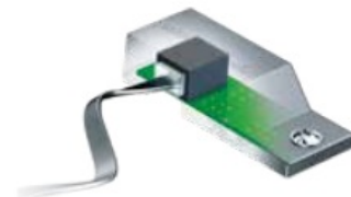
sensor obrotów (6200 impulsów/sek)