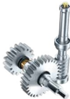
przekładnia z hartowanej stali